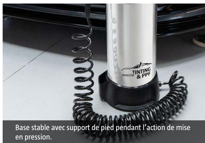
Base stable avec support de pied pendant l'action de mise en pression.