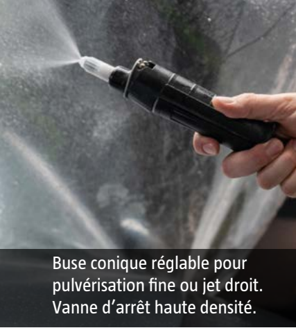
Buse conique réglable pour pulvérisation fine ou jet droit. Vanne d'arrêt haute densité.