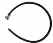
IK TINTING & PPF