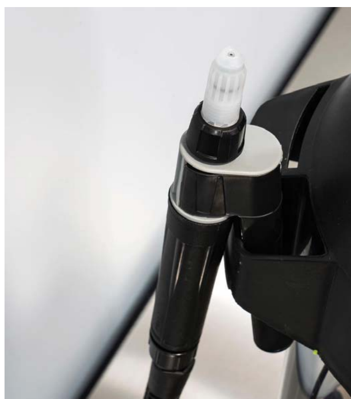
Support de rangement pour la poignée.