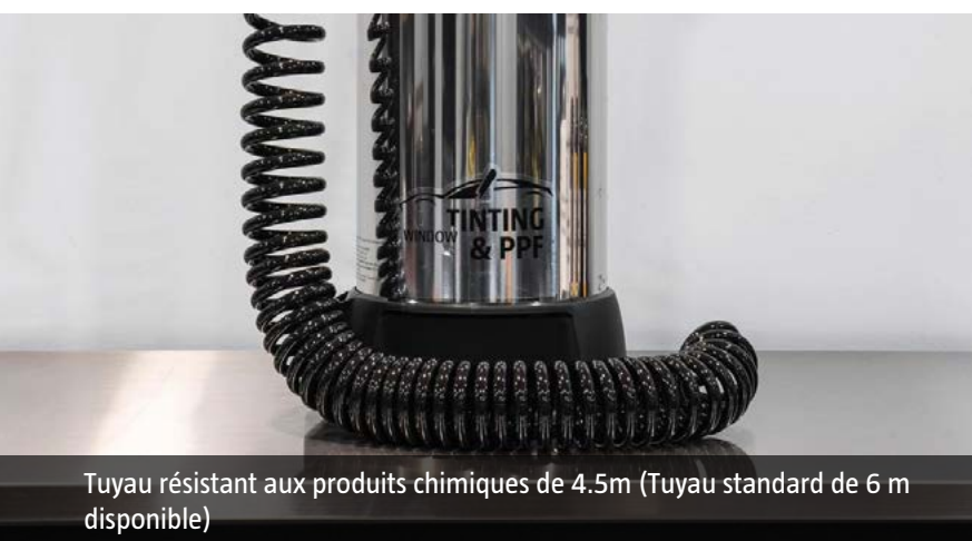
Tuyau résistant aux produits chimiques de 4.5m (Tuyau standard de 6 m disponible)