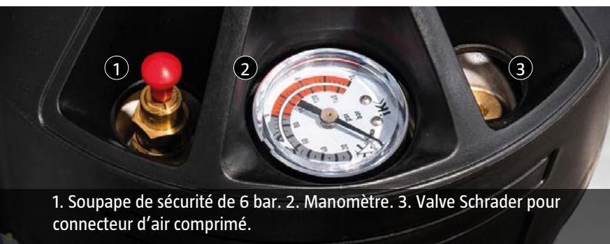
1. Soupape de sécurité de 6 bar. 2. Manomètre. 3. Valve Schrader pour connecteur d'air comprimé.