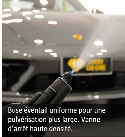
Buse éventail uniforme pour une pulvérisation plus large. Vanne d'arrêt haute densité.