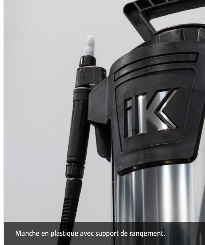
Manche en plastique avec support de rangement.